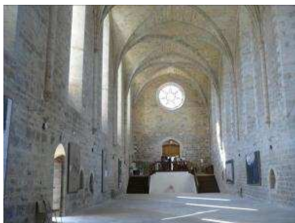
Visite de l'Abbaye de Beaulieu