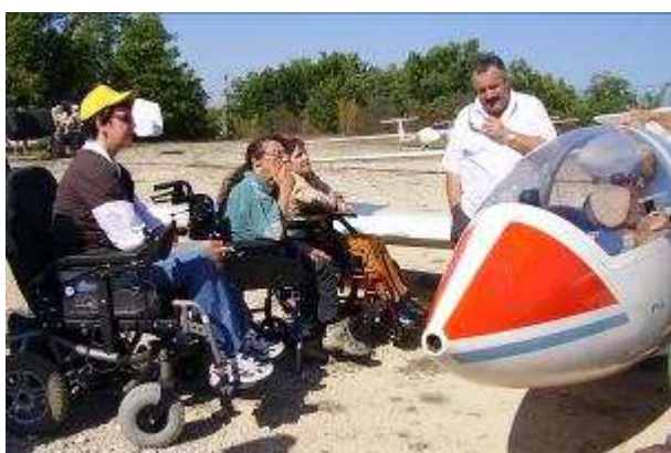
Baptême en planeur