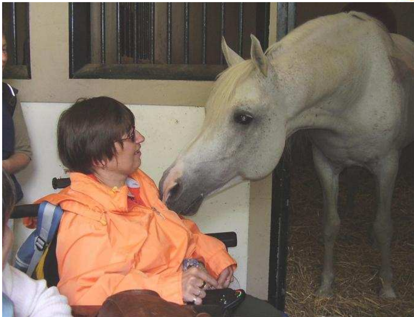
Le haras de Saintes - Voyage APF du Lot 2012

DELEGATION DU LOT Rue Michelet Résidence Michelet Bât. C n° 302 46000 CAHORS Tel : 05.65.35.73.03 Fax : 05.65.35.73.45 E-mail : dd.46@apf.asso.fr Blog : http://dd46.blogs.apf.asso.fr