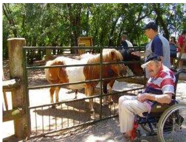
Parc animalier de Gramat