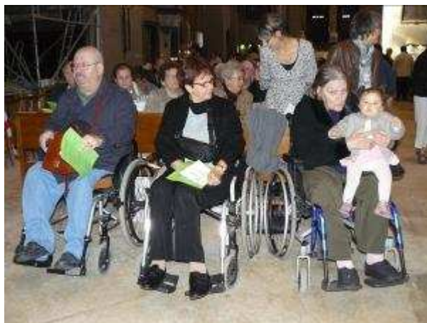
Invitation de la paroisse de Cahors à la messe de rentrée