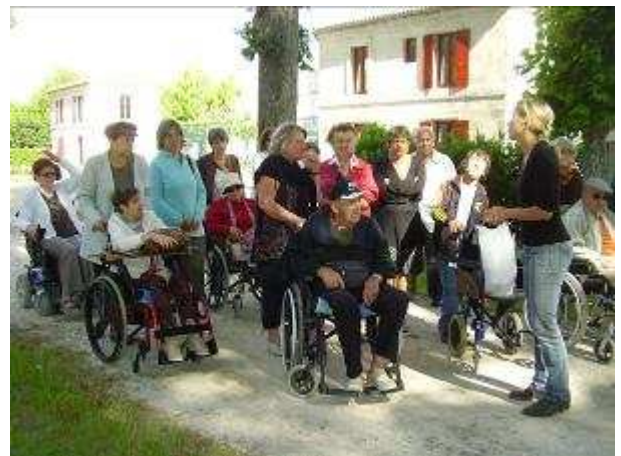
Visite du haras de Saintes