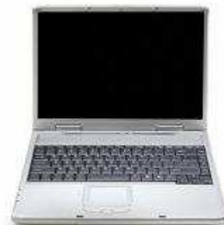
Bientôt un atelier informatique

Deux bénévoles travaillent pour mettre en place des ateliers informatiques.