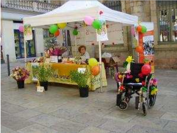
Fête du sourire sur le parvis de la Mairie