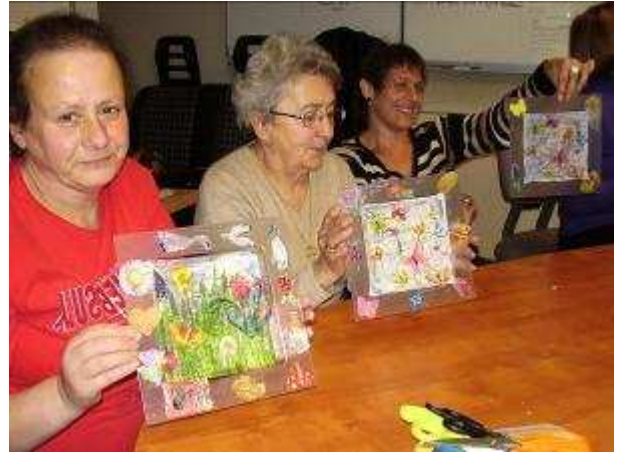
Atelier créatif à l'APF